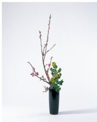
(師範科一期) 瓶花直立型