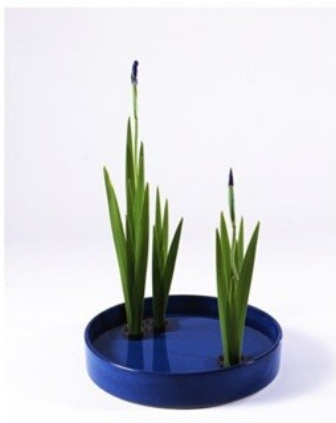
(師範科二期) 写景盛花様式本位 (近景)