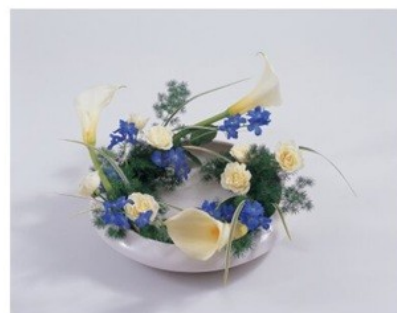
(准教授) まわるかたち