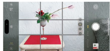
グリッド線上に配置する構図